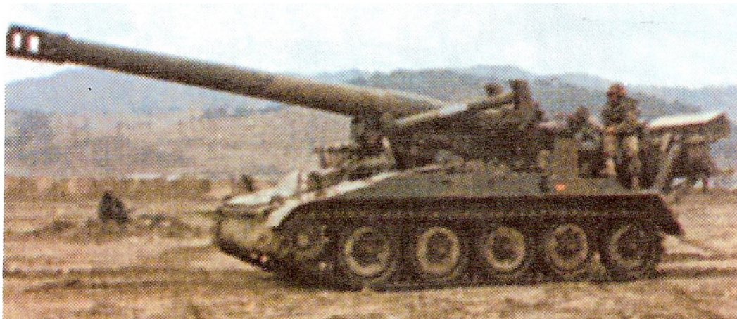
203 mm M110A2