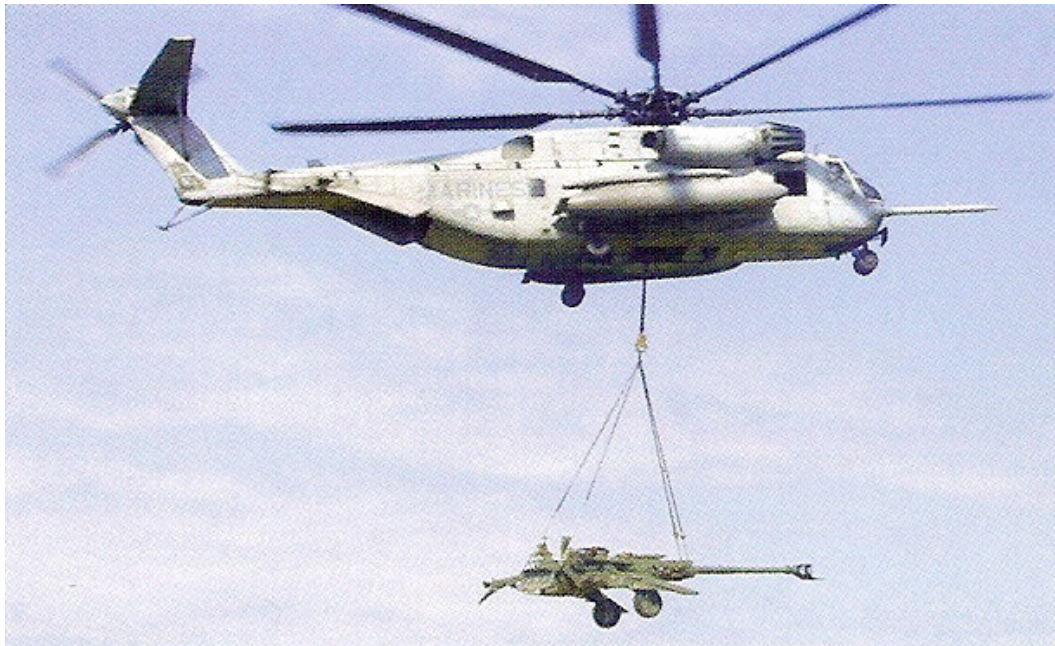
Transport helikopterom haubice 155 mm M777A1