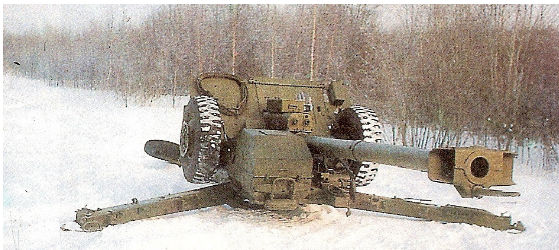
125 mm "Sprut-B"

Samopokretni protivtenkovski top 125 mm "Sprut-B" razvijen je početkom 1990-ih. To je pouzdano i efikasno oruđe sa glatkom cevi koje se na bojnopolju kreće sopstvenim pogonom brzinom do 10 km/h sa autonomijom kretanja do 50 km. Top može da bude vučen točkaškim ili višenamenskim guseničnim vozilom. Može da uništava oklopna borbena vozila u mestu ili u pokretu neposrednim ili posrednim gađanjem podkalibarnim projektilima na daljini do 2000 m. Brzina gađanja, zbog automatskog sistema za punjenje i usavršenog uređaja za pokretanje cevi po pravcu ( 360^\circ ) i po visini ( -6^\circ \div 25^\circ ), iznosi 6 \div 8 met./min. Masa topa je 6357 kg, a opslužuje ga 7 vojnika. Opremljen je nišanskim spravama za dnevno, noćno i posredno gađanje. Pomoću specijalnog uređaja top ispaljuje raketne projektele 3ZUBK-14 kojima efikasno može da uništava ciljeve na daljinama do 4000 m.