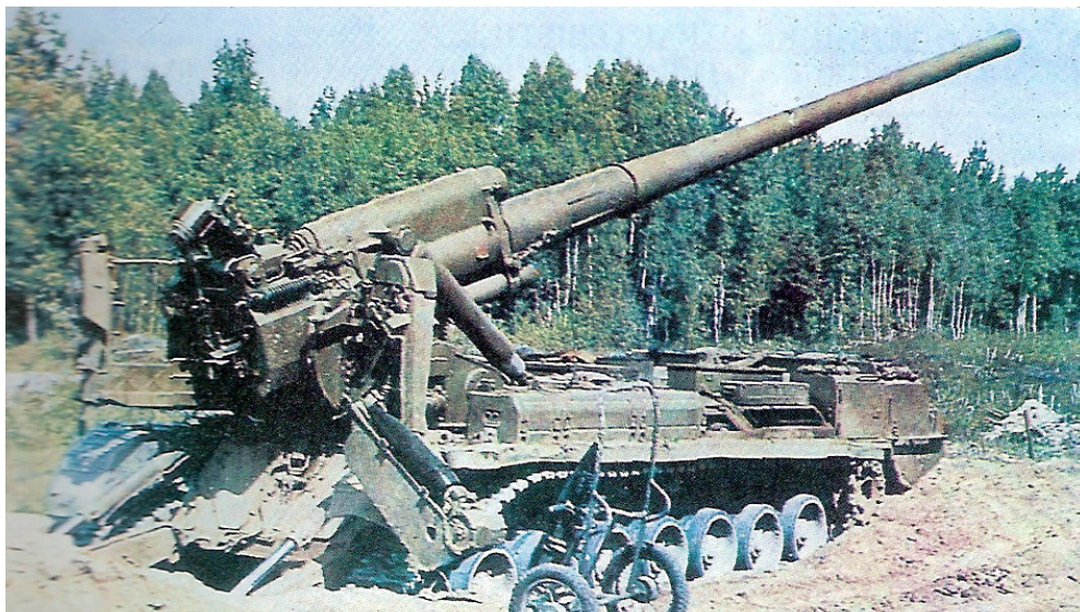
203 mm 2S7 Pion

Samohodni top 203 mm 2S7 Pion je bio prvo rusko samohodno oruđe otvorene ugradnje. Uveden je u naoružanje 1975. god. U prednjem delu tela guseničnog vozila je oklopljena kabina za smeštaj posade od 4 vojnika. Iza kabine je motorno odeljenje sa motorom tenka T-80. Na zadnjem delu je ugrađeno osnovno oruđe, a sasvim pozadi ašov koji se hidrauličnim pokretanjem oslanja na zemlju i pri opaljenju metka prima silu trzanja. Masa oruđa je 40 000 kg, a maksimalni domet preko 30 km.