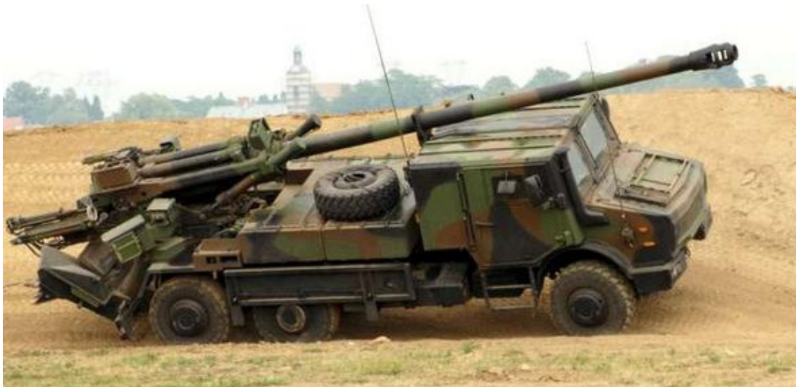
155 mm CAESAR

Najnoviji francuski samohodni artiljerijski sistem otvorene ugradnje kalibra 155 mm dužine cevi 52 kalibra razvila je korporacija GIAT Industries, sa namenom da zameni sisteme francuskih vučnih topova 155 mm TRF1. CAESAR je evoluirao od francuske samohodne haubice 155 mm F3 na šasiji lakog tenka AMX-13 (gusenično vozilo). Ranija verzija CAESAR-a koristila je kamione Daimler Benz Unimog 6x6. Najnoviji sistemi za francusku armiju (naručeni 2004. god.) su na šasiji kamiona Renault Sherpa 5 6x6.