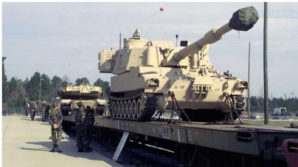
155 mm M109A6 Paladin

razvila je najnoviju modifikaciju sistema Paladin, koja može da ispaljuje precizno vođene projekte 155 mm dalekog dometa XM92 Escalibur.