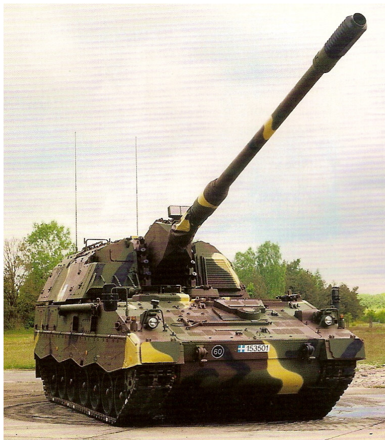
155 mm PzH 2000