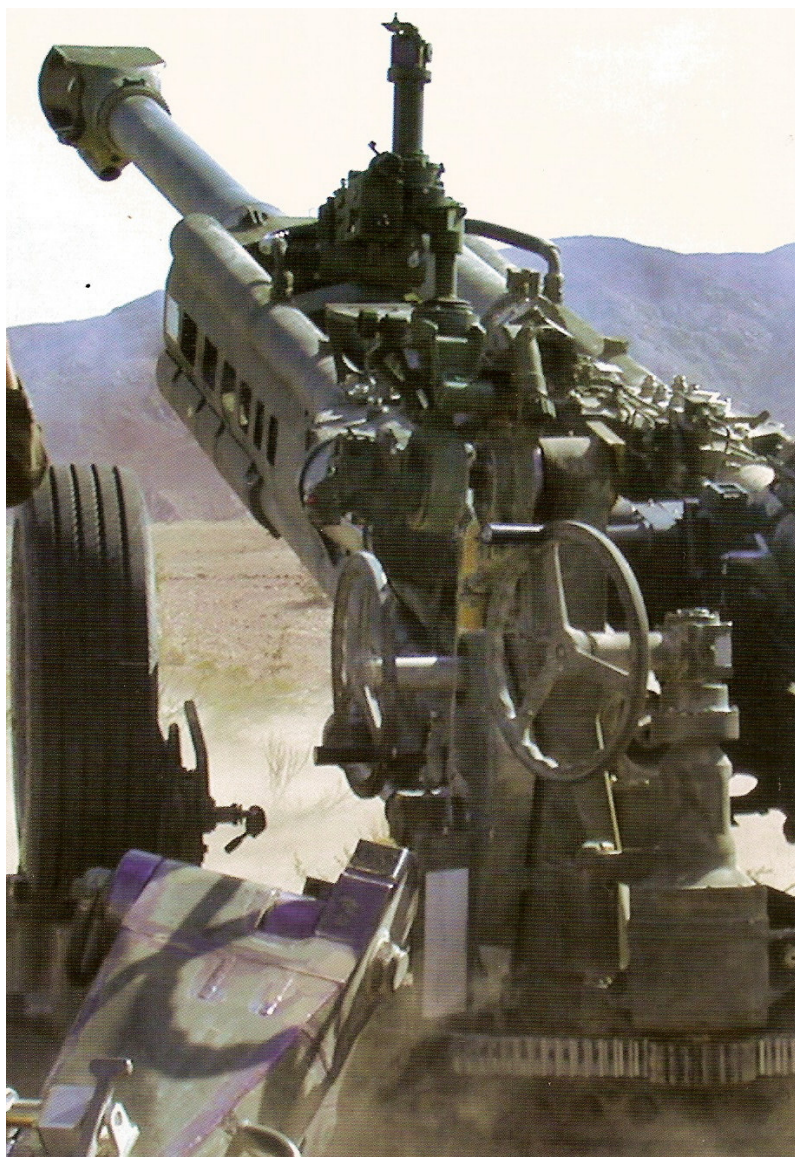
155 mm M777A1

Laka vučna haubica kalibra 155 mm dužine cevi 39 kalibara firme BAE Systems (ranije. Armaments Group of Vickers). To je prva haubica kalibra 155 mm u svetu koja je lakša od 4 500 kg. Američka armija je pokrenula uvođenje u naoružanje haubice M777 sa ciljem da zameni postojeće vučne haubice 155 mm M198. Korišćenjem proverenih tehnologija i inovativnom upotrebom legura titana i aluminijuma masa haubice M777 je za 3175 kg manja od mase haubice M198.