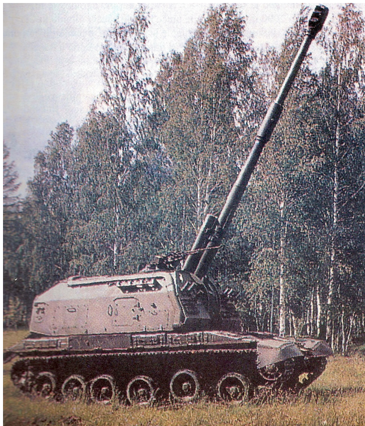
152 mm 2S19 MST-A-S

je sa tenka T-80. Cev i kupola pokreću se električnim pogonom, a punjenje je potpuno automatizovano, uključujući transporter za donošenje municije sa tla u kupolu. Polje dejstva po visini je od -3^{\circ} do 68^{\circ} , po pravcu 360^{\circ} , a maksimalna brzina gađanja 8 met./min. Pomoćno naoružanje je mitraljez 12.7 mm sa daljinskim upravljanjem. Nišanska sprava za posredno gađanje povezana je sa SUV Faljacet. Masa oruđa je 42 500 kg, maksimalni domet HE projektila mase 43.56 kg je 24 700 m, a borbeni komplet čini 50 metaka za haubicu i 300 metaka za mitraljez. Posada broji 5 vojnika. Maksimalna brzina kretanja je 60 km/h, a autonomija 500 km. Iz haubice MST-A-S mogu da se ispaljuju laserski vođeni projektili Krasnopolj.